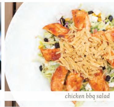
chicken bbq salad