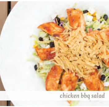
chicken bbq salad